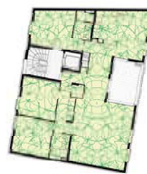
Plan 1er étage 143 m 2