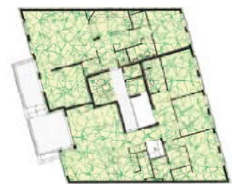
Plan 2ème étage 230 m 2