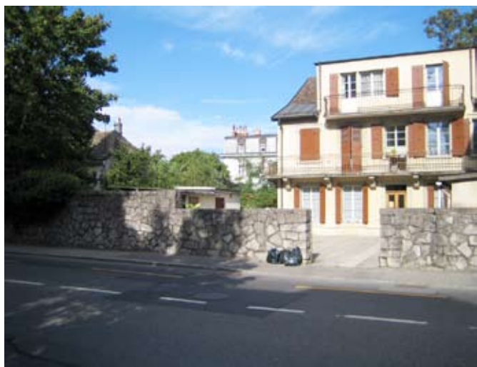
RUE DE LAUSANNE 9-11

Au moment où nous mettons sous presse est parue la mise à l'enquête d'un grand immeuble de 36 appartements à la rue de Lausanne 9-11. Nous n'avons pas encore pris position sur ce projet.