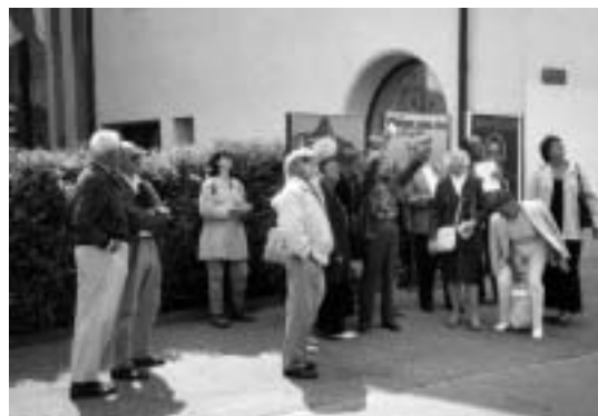
Les guides ASM / MDA observent le casino

Grâce à la collaboration de plusieurs sociétés morgiennes une manifestation de grande ampleur est en train de se mettre sur pied ; si nos informations sont exactes, la journée « SAVEURS DU MONDE » devrait transformer toute la Grand'Rue en table conviviale le dimanche 2 juin prochain.